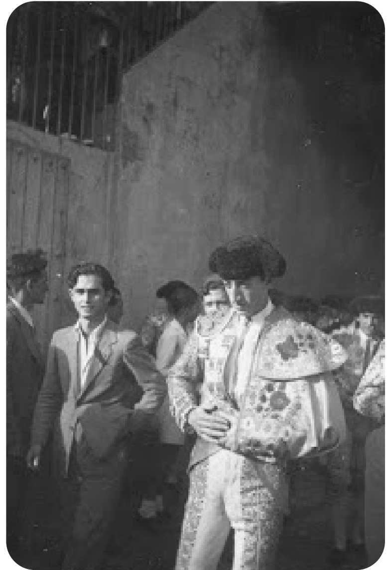
Manolete apodó a la plaza de toros de Villanueva del Arzobispo como "la perla del sur"